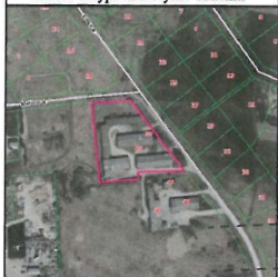
Žemės sklypo išdėstymo schema